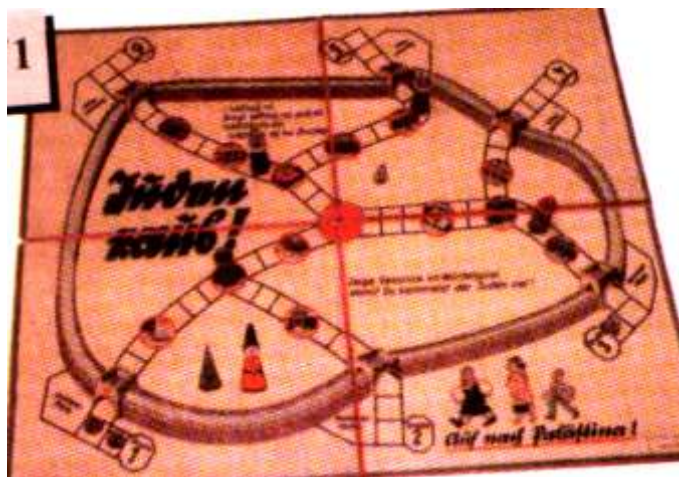
Німецька гра для дітей та дорослих під назвою “Вижени євреїв”

Євреї, які становили менше 1% населення Німеччини, були проголошені чи не головними ворогами диктатури. Нацисти поставили за мету вилучити “неарійців” з громадського життя (нацистське тлумачення “неарійці” передбачало осіб, що мали батьків чи дідусів євреїв.) Євреям було заборонено займатися громадськими справами, викладати в школах і університетах, практикувати лікарями, стоматологами і юристами, в їхніх паспортах ставились спеціальні позначки й усім жінкам дописували ім'я Сара а чоловікам Ізраїль.