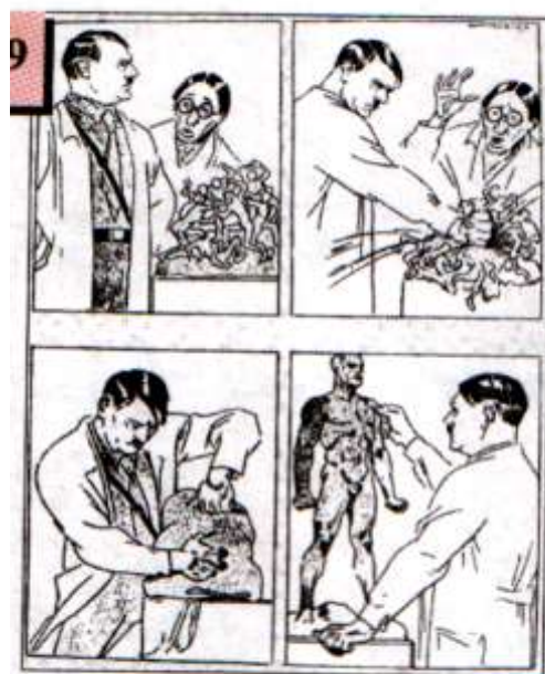
Творення нової людини

Розчленування України стало однією зі складових політики “нового порядку”, метою якої було створення українських земель на життєвий простір для арійської раси. Українські землі ,як найбільш родючі, мали стати джерелом