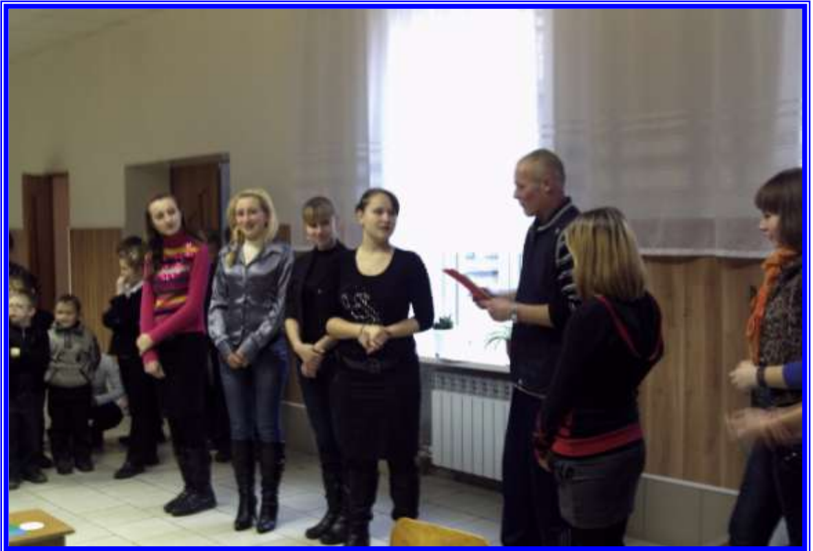
Створення та розповсюдження пам'яток «Твої права дитино»