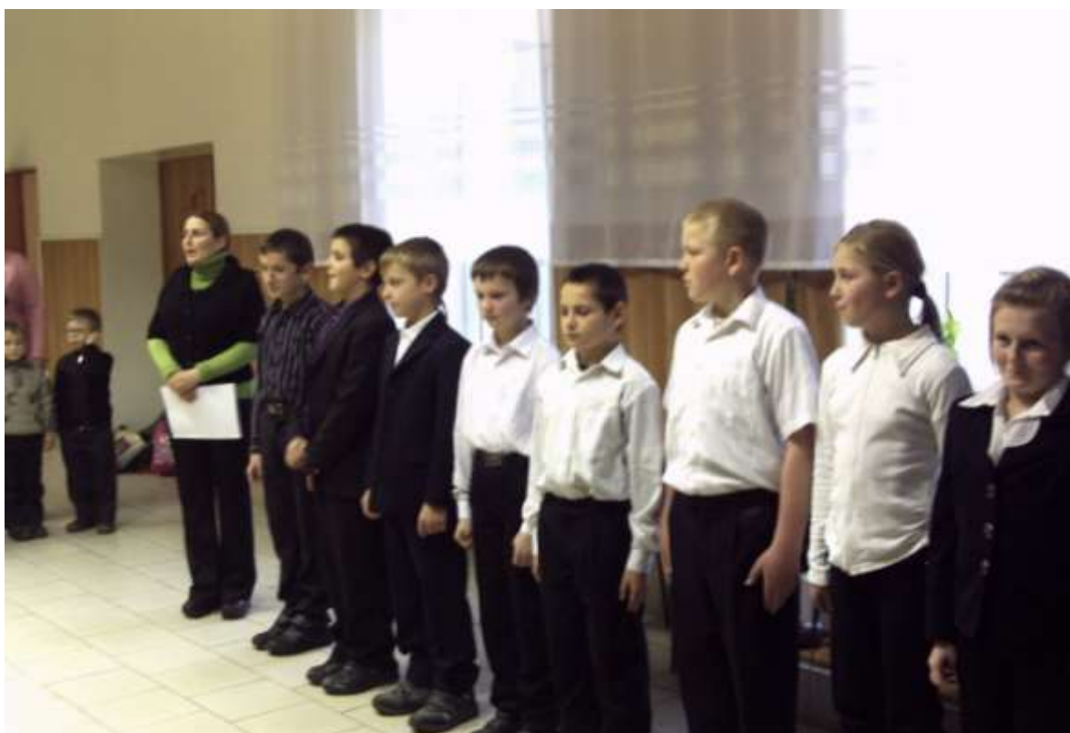
Тематична книжкова виставка - презентація «Дітям про їх права»